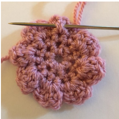
4 Pak de achter lussen