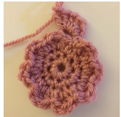
5 v en 5st in dezelfde K ruimte